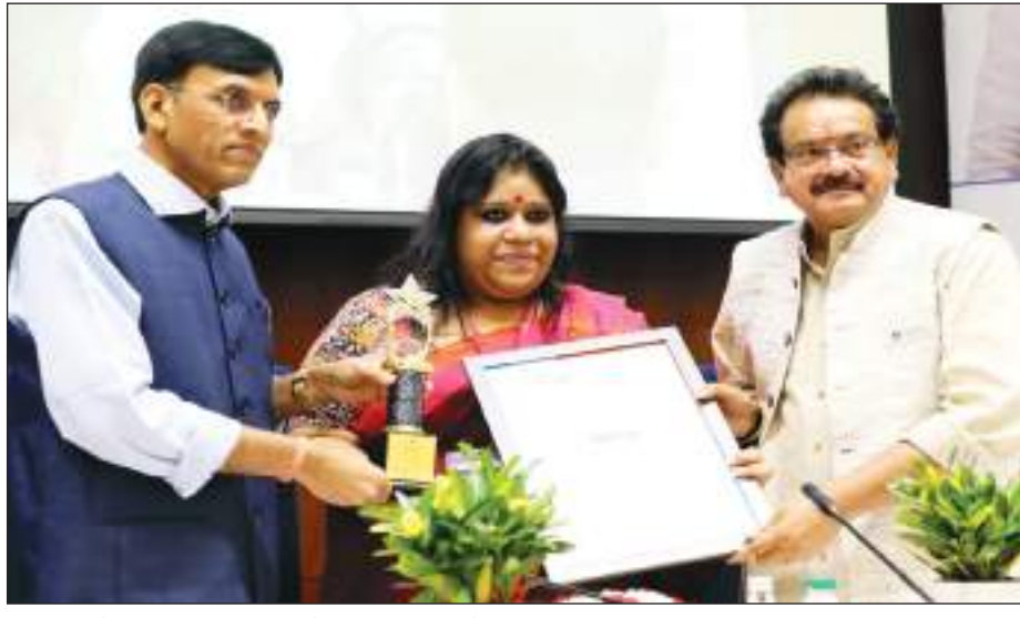
नई दिल्ली में बुधवार को केन्द्रीय स्वास्थ्य मंत्री डॉ. मनसुख मंडाविया ने विश्व खाद्य सुरक्षा दिवस के अवसर पर चौथा राज्य खाद्य सुरक्षा सूचकांक जारी किया।

अभी बाकी है। जो दिवटर पर राजनीति करते हैं वो समाज के बीच नहीं जा पाते हैं। सपा, बसपा, कांग्रेस को वोट देकर बर्बाद नहीं करना है। क्योंकि इनको वोट देने से देश में सरकार नहीं बनेगी।